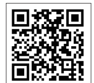
大会の詳細はこちら